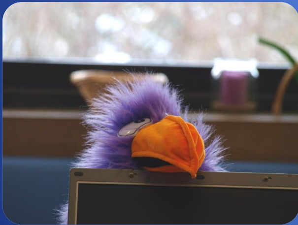
LennoGS das Maskottchen der OGS

Wir sind unter der Diensthandynummer 0175/7922306 und per Email unter andrea.lindner@jmf-gymnasium.de bzw. nadine.hof@jmf-gymnasium.de für Sie erreichbar!